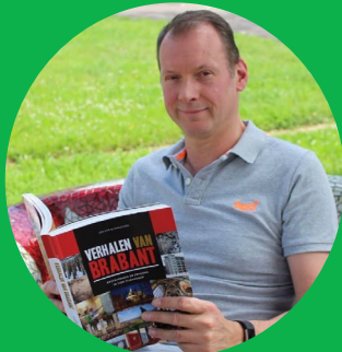
Matthijs van Miltenburg

"D66 wil een toekomstbestendige landbouw in nauwe samenwerking met gemeenten, agrarische ondernemers, milieu- en natuurorganisaties, natuurterreinbeheerders, industrie, waterschappen en particuliere eigenaren!"